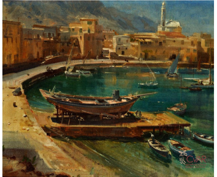
Wootton Frank, Ήσυχη αποβάθρα, 1950