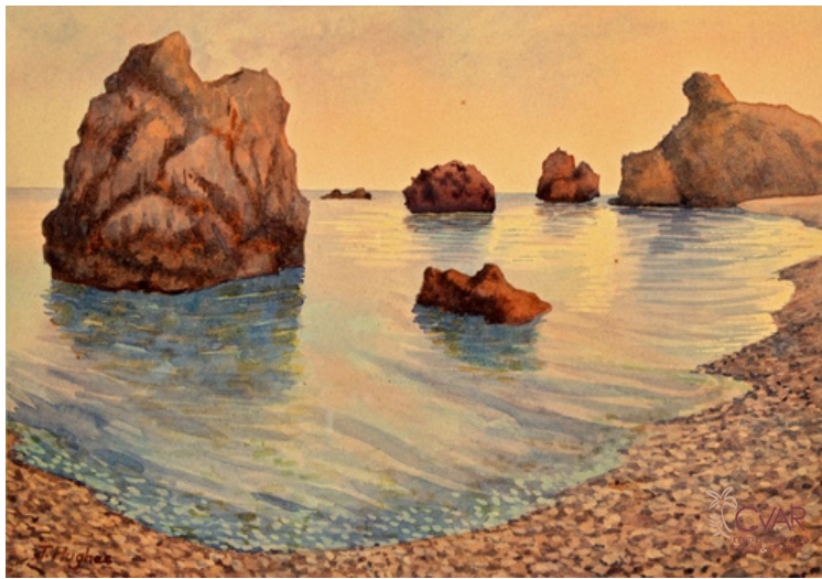
Hughes J., Πέτρα του Ρωμιού, 1950