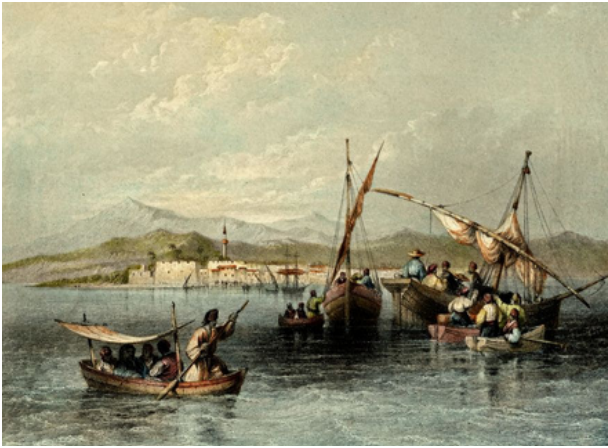
Bartlett W. H., Λάρνακα, 1853