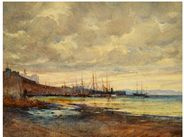
Legge Arthur J., Το λιμάνι της Αμμοχώστου, 1928