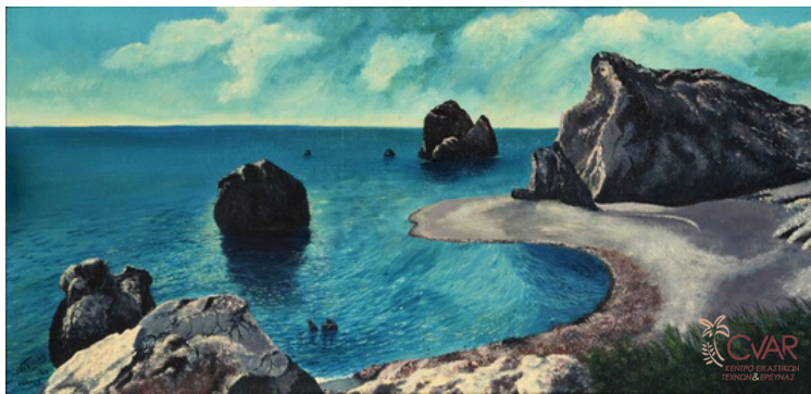
Loon Van L., Κύπρος, 1996