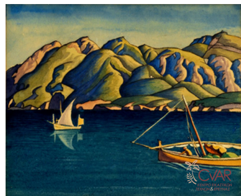
White Ethelbert, Η ακτή, 1950