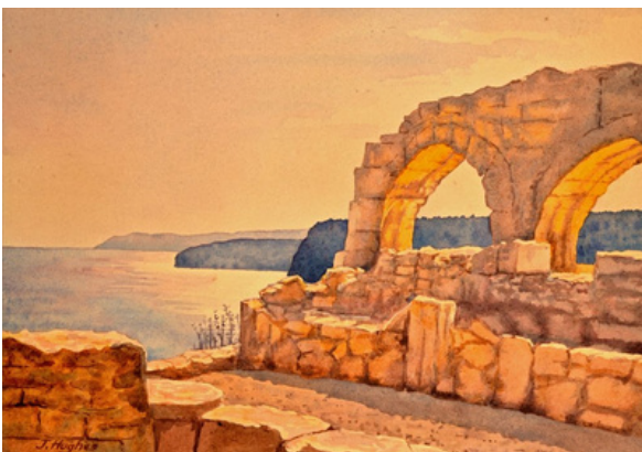
Hughes J., Πάφος- Αγία Κυριακή, 1950