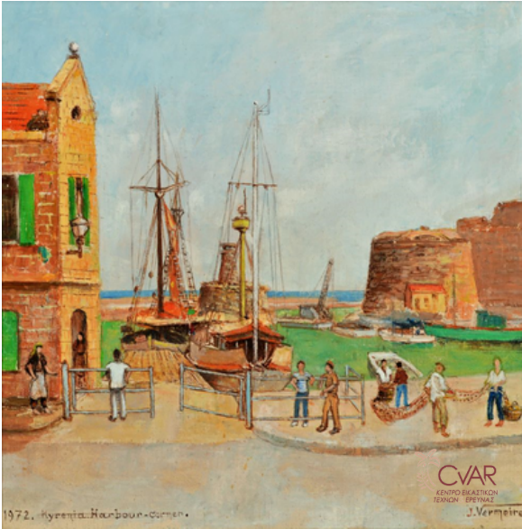
Vermeiren Joseph, Το λιμάνι της Κερύνειας, 1972