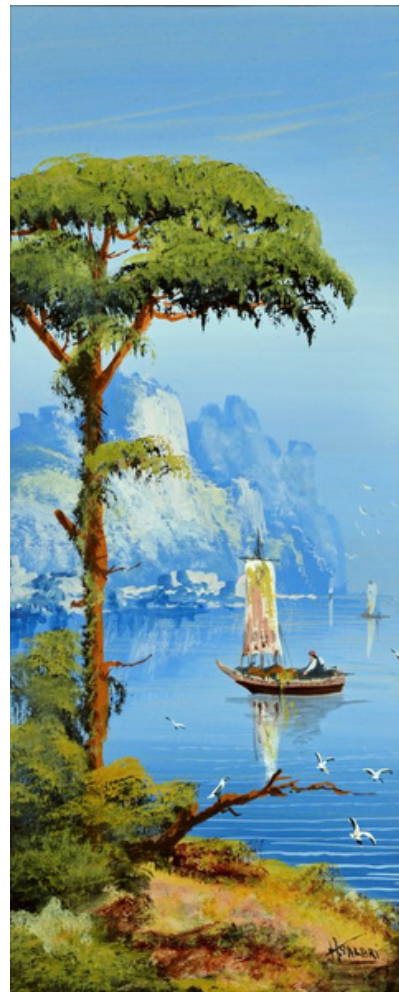
Salari H., Κοντά στην Κύπρο, 1900